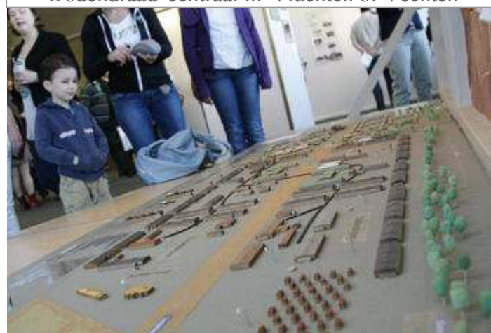
'Dodendraad' centraal in 'Vluchten of Vechten'