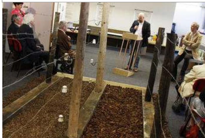
'Dodendraad' centraal in 'Vluchten of Vechten'