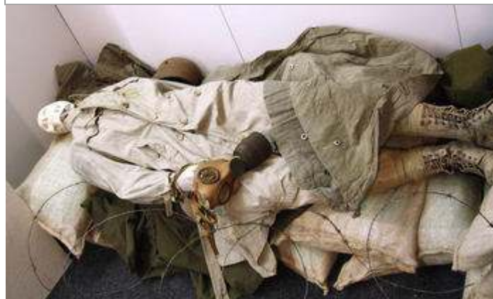
'Dodendraad' centraal in 'Vluchten of Vechten'