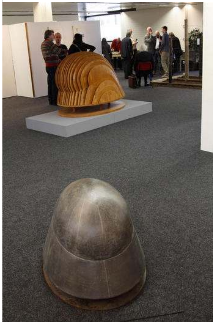
'Dodendraad' centraal in 'Vluchten of Vechten'