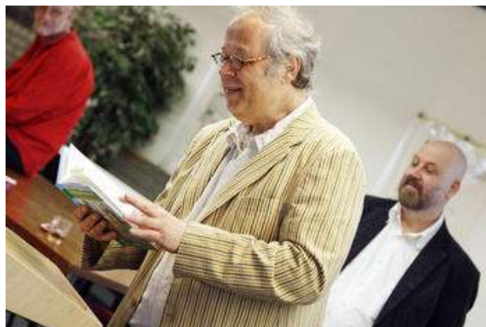
'Dodendraad' centraal in 'Vluchten of Vechten'